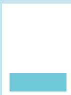
1/4 sivu: 166 x 54 mm