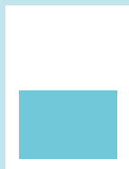
1/2 sivu: 166 x 115 mm