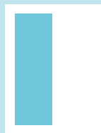
1/2 sivu: 80 x 237 mm

HUOM! Leikkuuvara aukeaman ja koko- sivun ilmoituksissa: 3 mm