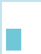
1/4 sivu: 80 x 115 mm