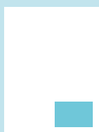
1/8 sivu: 80 x 54 mm

HUOM! Leikkuuvara kaikissa ilmoituksissa: 3 mm